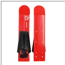
Original Figl mit Universalbindung.